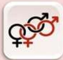
Representación de Diversidad sexual