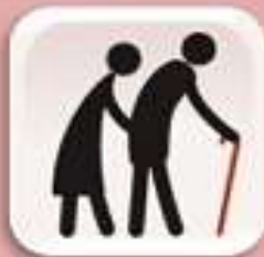
Representación de adultos/as mayores