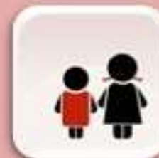
Representación de niños y niñas