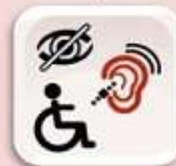
Representación de personas con discapacidad