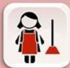
Representación de Trabajadoras/es del hogar