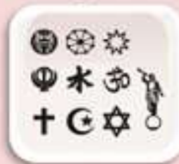
Representación de Diversidad religiosa