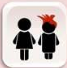
Representación de Jóvenes