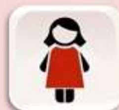
Representación de Mujeres