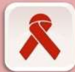
Representación de personas con VIH/SIDA