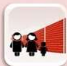
Representación de Migrantes