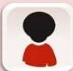
Representación de afrodescendientes